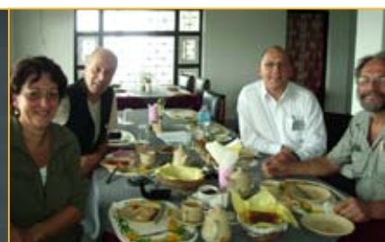
→ TEAMPHOTO :)